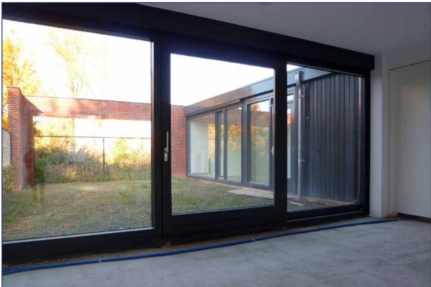
Patio via schuifpui vanuit de keuken bereikbaar